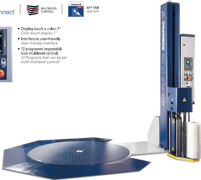
LAYOUT ROTOPLAT LP 708 PVS [mm]